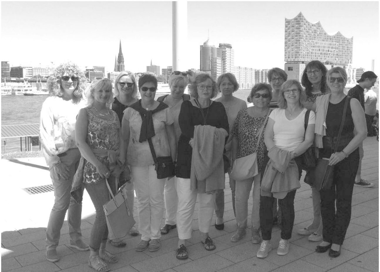
Die Woltorfer Walkerinnen an der Südseite des Alten Elbtunnels in Hamburg.

Ebenso nahmen wir zahlreich am Umzug des Woltorfer Volksfestes teil.